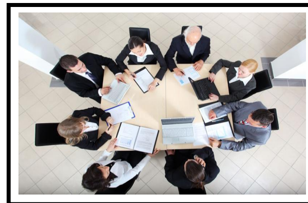
Comitato Valutazione Sinistri