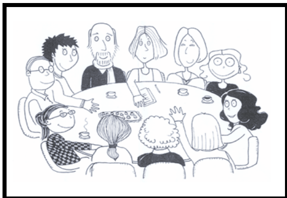
Gruppo di coordinamento per la gestione del rischio

All'interno di ogni Azienda Ospedaliera / A.S.L. in Regione Lombardia è stata istituita la figura del RISK MANAGER ed esistono i seguenti 2 gruppi: